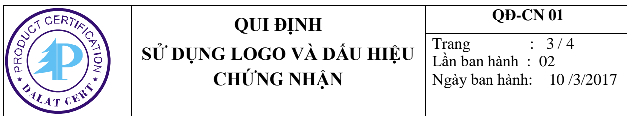
Hình 3: dấu chứng nhận hợp chuẩn