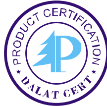
Hình 1: Logo của Trung tâm